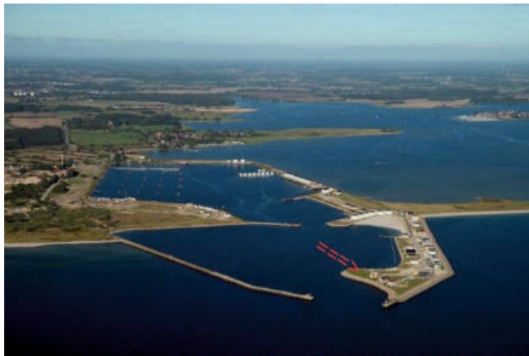
Residenz Bollwark, Port Olpenitz

Sehen Sie sich das Foto an, ein solches Grundstück finden Sie nur selten!